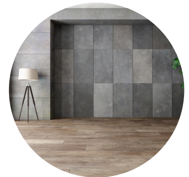
Parquets 55.-/m 2