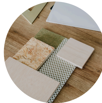
Carrelages 50.-/m 2