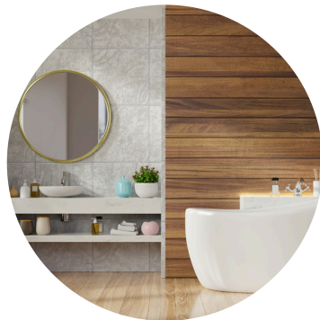
Appareils sanitaires 13'000 CHF