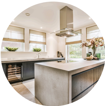
Cuisine 22'000 CHF